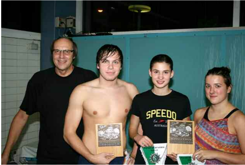
Ehrung der besten Einzelleistungen

Aktiven des Duisburger Schwimm Team ebenfalls überzeugen und 6 Mal die Goldmedaille holen. Alles in allem ein super Wochenende für die Organisatoren um PSV-Abteilungsleiter Ernst-Dieter Stolte und Schwimmwart Marc Brinkmann.