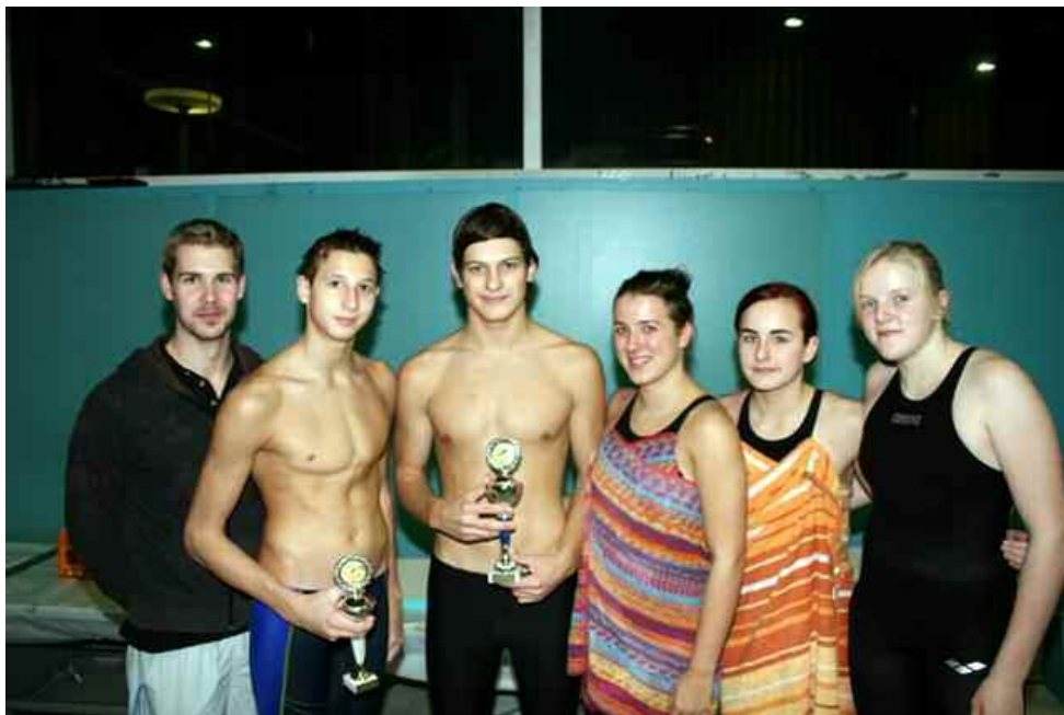
Pokalübergabe an das Duisburger Schwimm-Team für den besten Verein